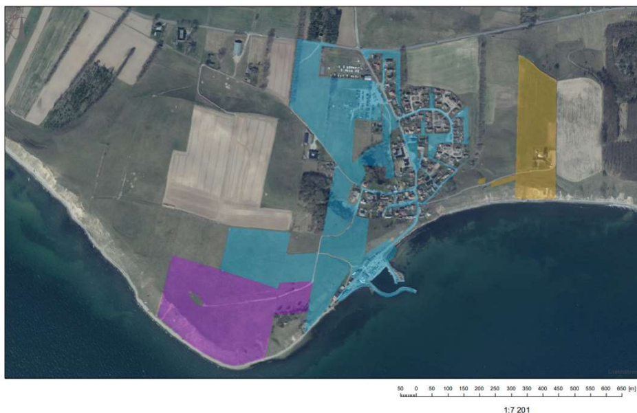
Figur 1. Kartan visar markägarförhållanden i Kåseberga. Blåmarkerad mark är kommunalt ägd. Lila tillhör Statens fastighetsverk och gult tillhör Fortifikationsverket.

I Kåseberga finns en relativt stor andel kommunal mark, allmän platsmark förekommer. Statens fastighetsverk äger ytorna vid Ales stenar. Därtill är även mark i byns östra del statligt ägd. Övrig mark är privatägd.