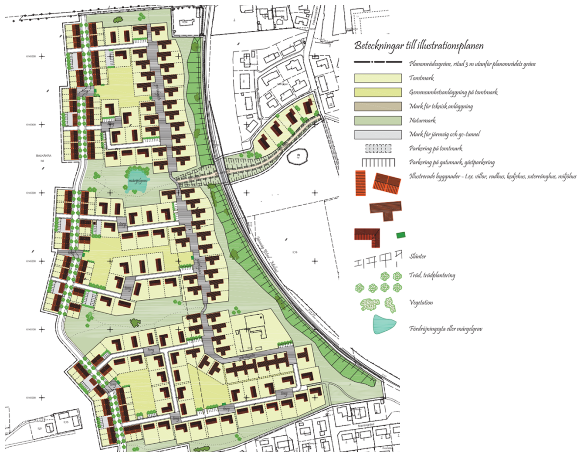
Figur 3. Illustrationsplan utbyggnad västra Svarte.