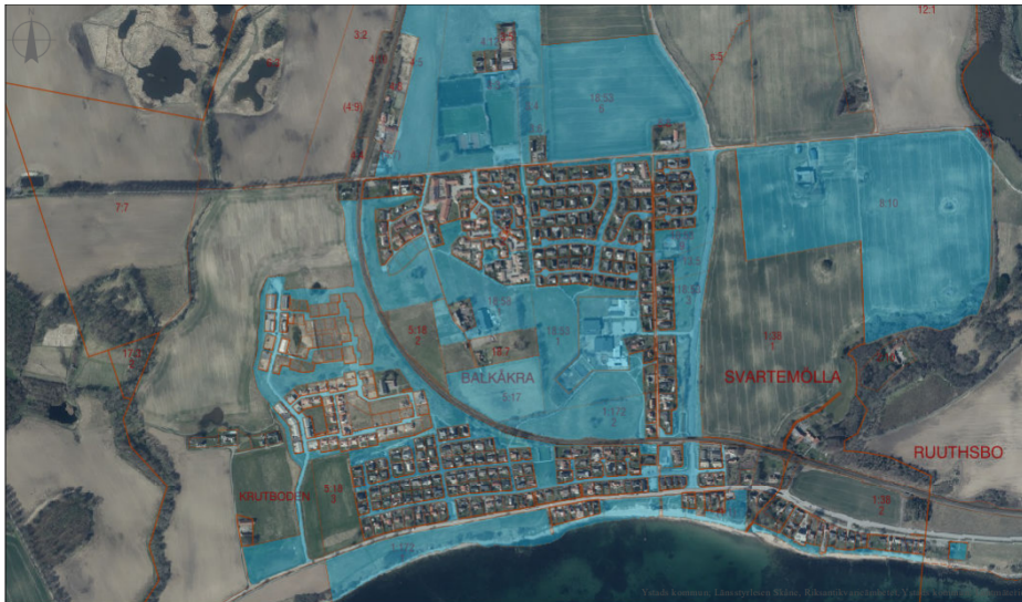
Figur 1. Kartan visar markägoförhållanden i Svarte. Blåmarkerad mark ägs av Ystads kommun.

I Svarte finns en stor andel kommunal mark och allmän platsmark förekommer. Övrig mark är privatägd.